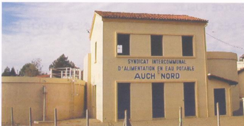
La Station de Pompage et de Traitement des Eaux du Rambert

Désormais, ce sont les mairies qui informent le SPANC des dossiers déposés afin que le projet puisse être vérifié et obtienne un avis favorable du service assainissement. Le permis de construire ne vaut pas autorisation d'assainir et le pétitionnaire doit s'assurer que son projet d'assainissement est réalisable. Il doit avoir obtenu l'accord du SPANC avant de réaliser ses travaux.